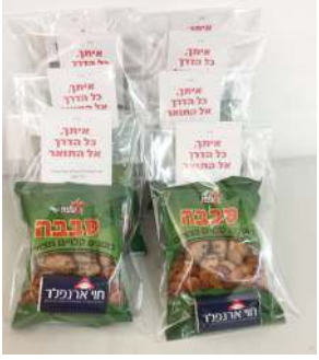
שי לסטודנטיות לימי ראיונות

אם את מתעניינת בלימודי תואר שני, חגית, יועצת הלימודים שלנו לתואר שני, תשמח לענות על כל שאלה!